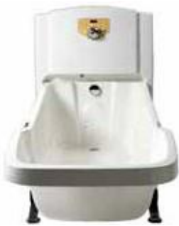
TR900 Modèle à autoremplissage