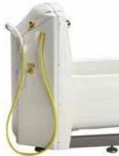
TR900 Modèle à nettoyage