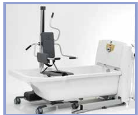
Baignoire réglable en hauteur TR900 avec élévateur d'hygiène TR9650

« La sensation de bien-être est naturellement bénéfique pour la santé. Prendre un bain est synonyme de détente absolue, en plus de favoriser la circulation sanguine et de stimuler les sens. »