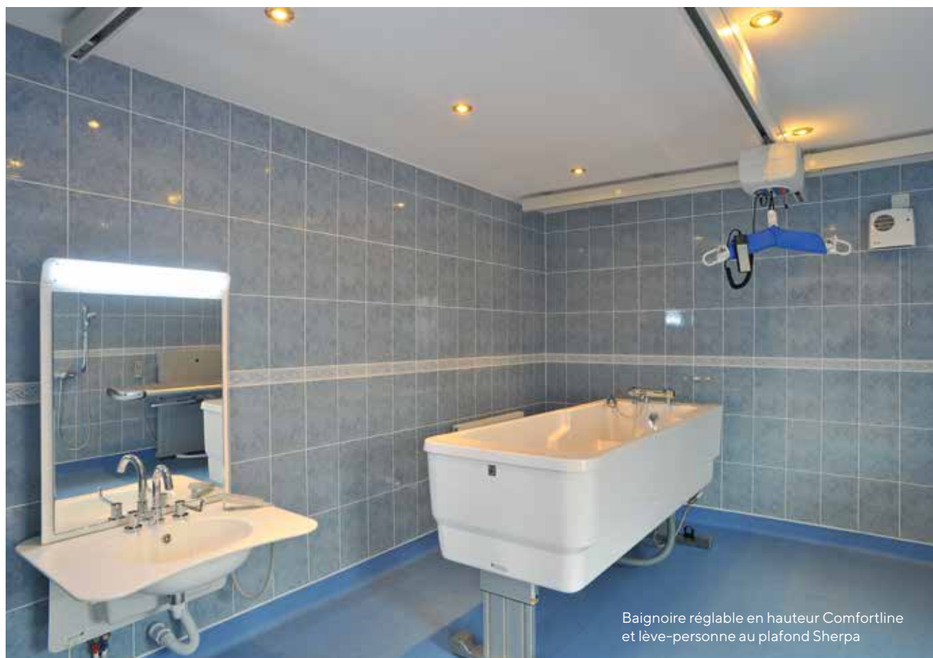
Baignoire réglable en hauteur Comfortline et lève-personne au plafond Sherpa