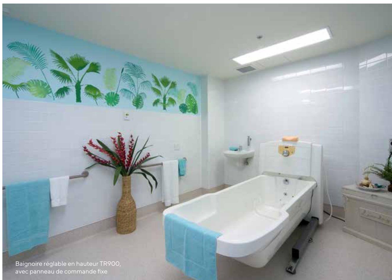
Baignoire réglable en hauteur TR900, avec panneau de commande fixe